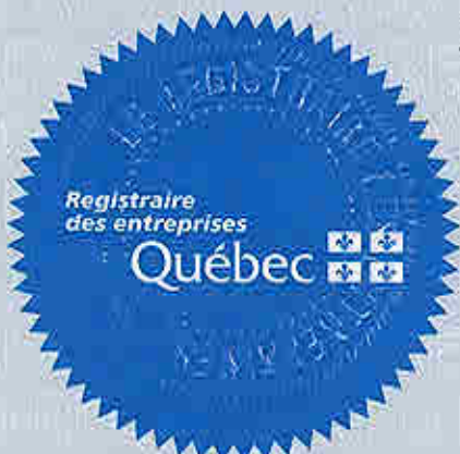
Registraire des entreprises par intérim

Déposées au registre le 15 septembre 2005 sous le matricule 1162168794